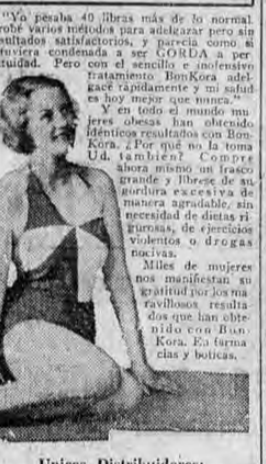
Unicos Distribuidores: Agencias MORENO, San José, C. R. De venta al por mayor en la Botica Oriental