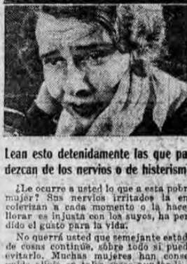
Lean esto detenidamente las que padezcan de los nervios o de histerismo

¿Le ocurre a usted lo que a esta pobre mujer? Sus nervios irritados la emborronaban en momentos de la histeria. Llorar es injusto con los suyos, ha perdido el gusto para la vida. No querrá usted que semejante estado de cosas continúe, sobre todo si puede evitarlo. Muchas mujeres han conseguido alivio en tales casos recurriendo a la naturaleza con el famoso Compuesto Vegetal de Lydia E. Pinkham. El Compuesto de Pinkham está hecho especialmente para la mujer. No contiene drogas dañinas, ni narcóticos, sino benéficas hierbas y raíces. Contribuye con la naturaleza a tonificar el organismo, proporcionando alivio alivio a los nervios agitados, a los períodos de abatimiento y al malestar asociado a los desarreglos femeninos. Por tres generaciones una mujer dice a otras que "para sentirse bien" no hay nada como el Compuesto de Pinkham, y más de un millón de mujeres agradecidas han escrito de los buenos resultados obtenidos. Pruébelo también usted.